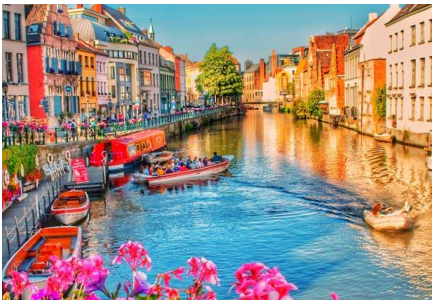
Bruges (Quartier ancien)