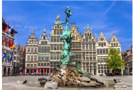
Anvers (la grande place)