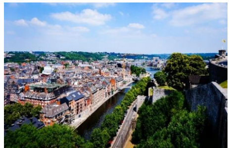
Namur (la Meuse)