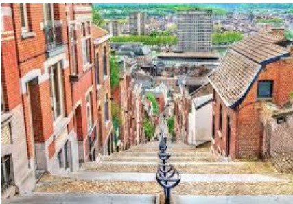
Liège (les marches de Buren...)