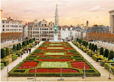
Jardins du Mont des Arts (Bruxelles)

Voici les autres endroits que nous vous recommandons :