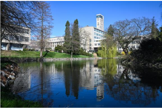
Campus de Bruxelles

Ces formations sont réparties sur deux Campus différents, l'un à Bruxelles (Anderlecht) et l'autre à Jodoigne (50 km à l'est de Bruxelles).