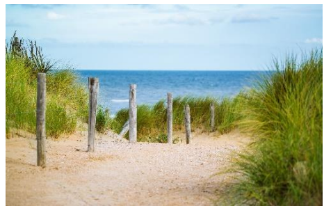
The Zwin (le parc naturel de la mer du nord)