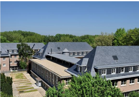
Campus de Jodoigne